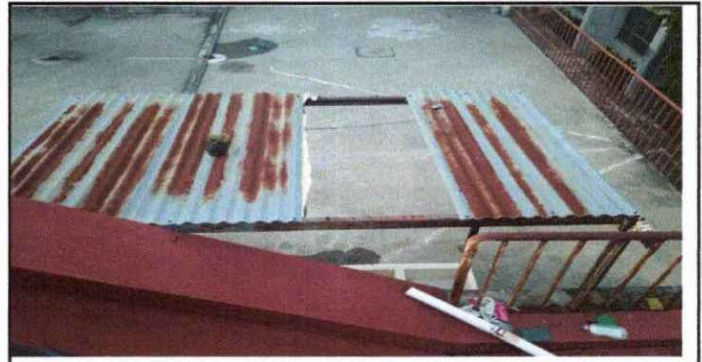
Foto 6: DESMONTAJE DE 3 LAMINAS EN MAL ESTADO Y CAMBIARLAS POR 4 NUEVAS DE 12 PIES

Observación: Si es necesario se pueden agregar hojas adicionales y actualizar el número de hojas.