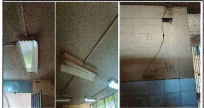
Foto 4: REPARACIÓN DE SISTEMA ELÉCTRICO INSTALACION DE 10 FLIPONES EN TABLEROS + SUSITUCION DE CABLE DE DIFERENTES CALIBRES, EN AREA DE TALLERES.