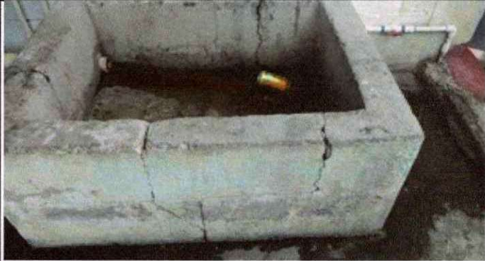
Foto 7: SUSTITUCIÓN DE PILETA DE PISO UBICADA FRENTE A LOS TALLERES DE COCINA POR UNA PILA PLÁSTICA DE UN LAVADERO TALISHE.