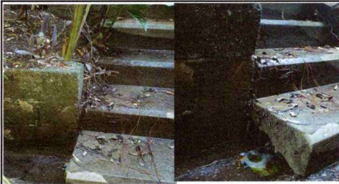
Foto 3: SUSTITUCIÓN DE TUBERÍA POR FUGA DE AGUA EN GRADAS EN JARDINERA COMPARTIDO CON LA JORNADA MATUTINA.