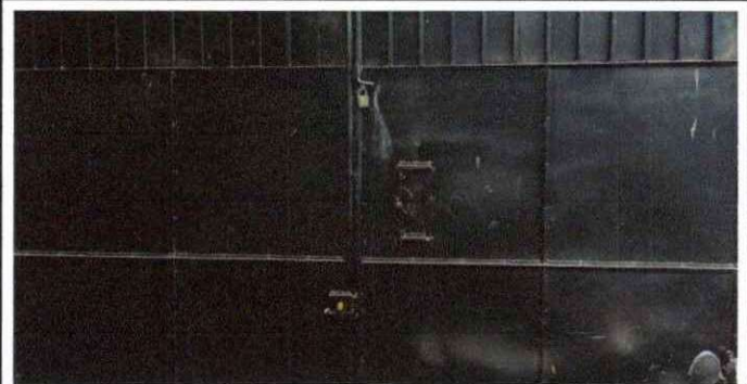
Foto 12: SUSTITUCIÓN DE CHAPA EN 1 PORTÓN DE INGRESO DE LA JORNADA VESPERTINA

Observación: Si es necesario se pueden agregar hojas adicionales y actualizar el número de hojas.