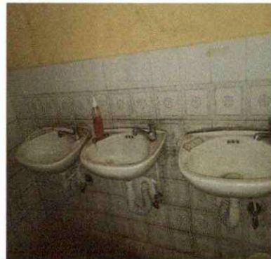
Foto 10: SUSTITUCIÓN DE 10 LAVAMANOS, 10 SIFONES VÁLVULA DE LAVAMANOS, CONTRA LLAVES DE MEDIA A LA PARED, CAMBIO DE LLAVE DE LAVA MANOS, EXISTENTES.