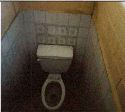
Foto 9: SUSTITUCIÓN DE 8 INODOROS EN MAL ESTADO POR INODOROS NUEVOS