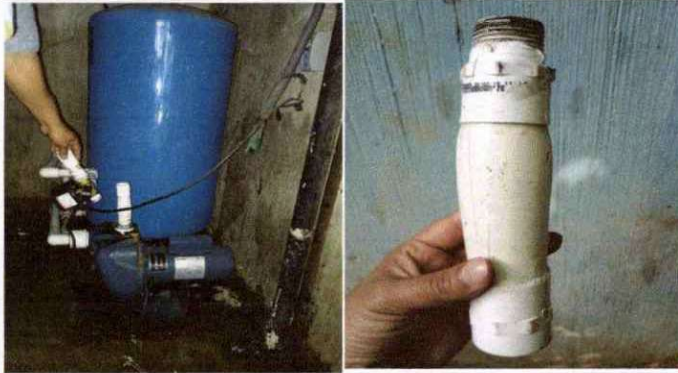
Foto 1: SUSTITUCIÓN DE TUBERÍA DE BOMBA. INCLUYE, CONEXIÓN HIDRÁULICA, ELÉCTRICA MATERIALES Y ACCESORIOS NECESARIOS, ACCESORIOS DE PVC Y TUBERÍA