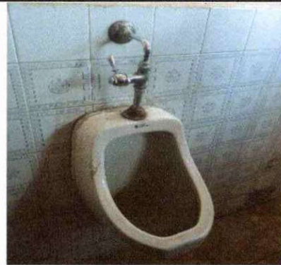
Foto 8 SUSTITUCION DE MINGITORIOS EXISTENTES EN MAL ESTADO POR NUEVOS