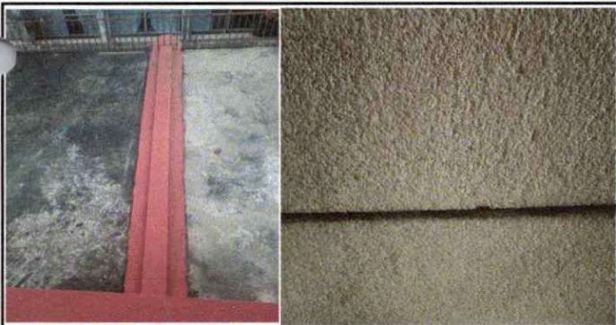
Foto 5: REPARACION DE JUNTA SISMICA, EN MODULO DE SALONES DE DOS EDIFICIOS COMPARTIDO CON JORNADA MATUTINA